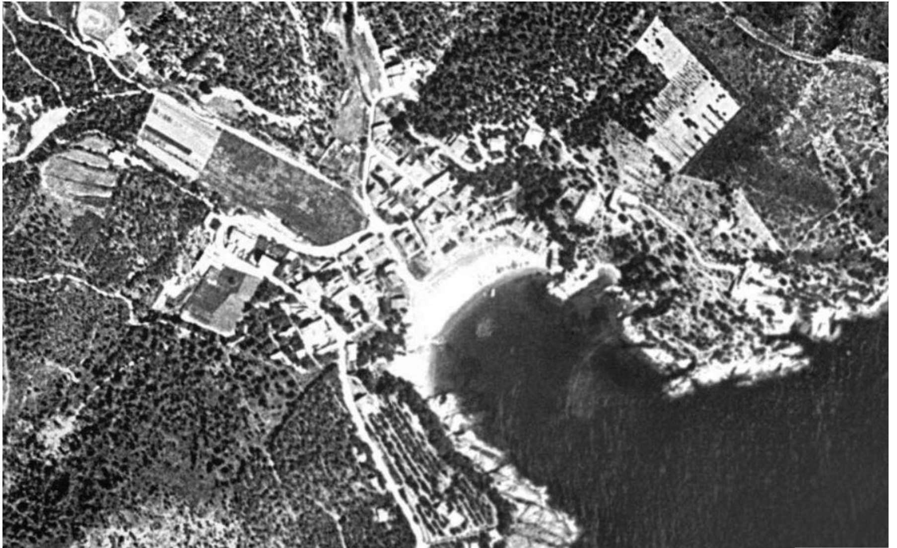
Taamriu 1956, ICGC