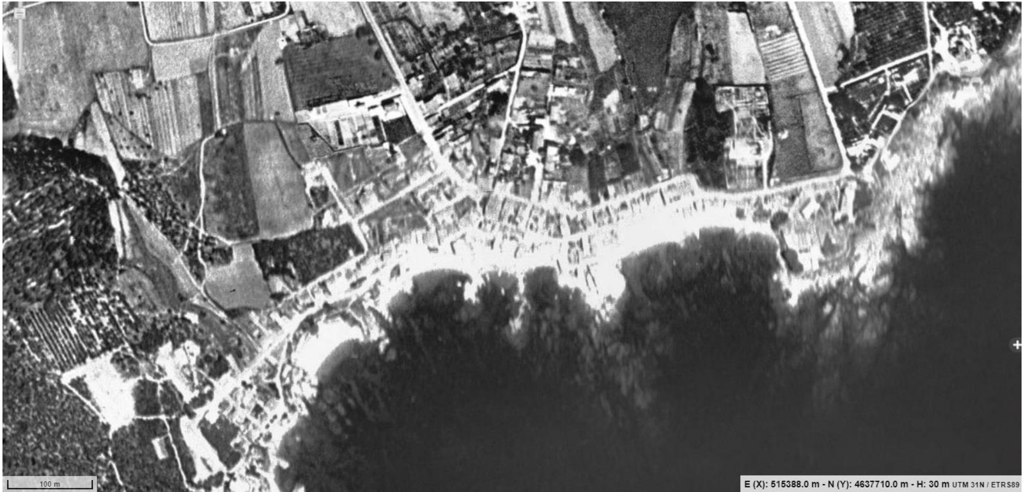
Calella 1956, ICGC