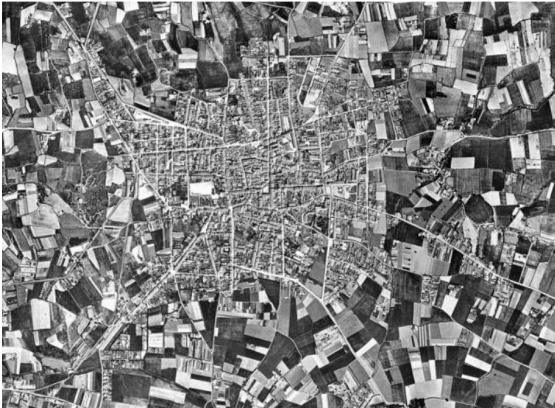
Palafugell 1956, ICGC