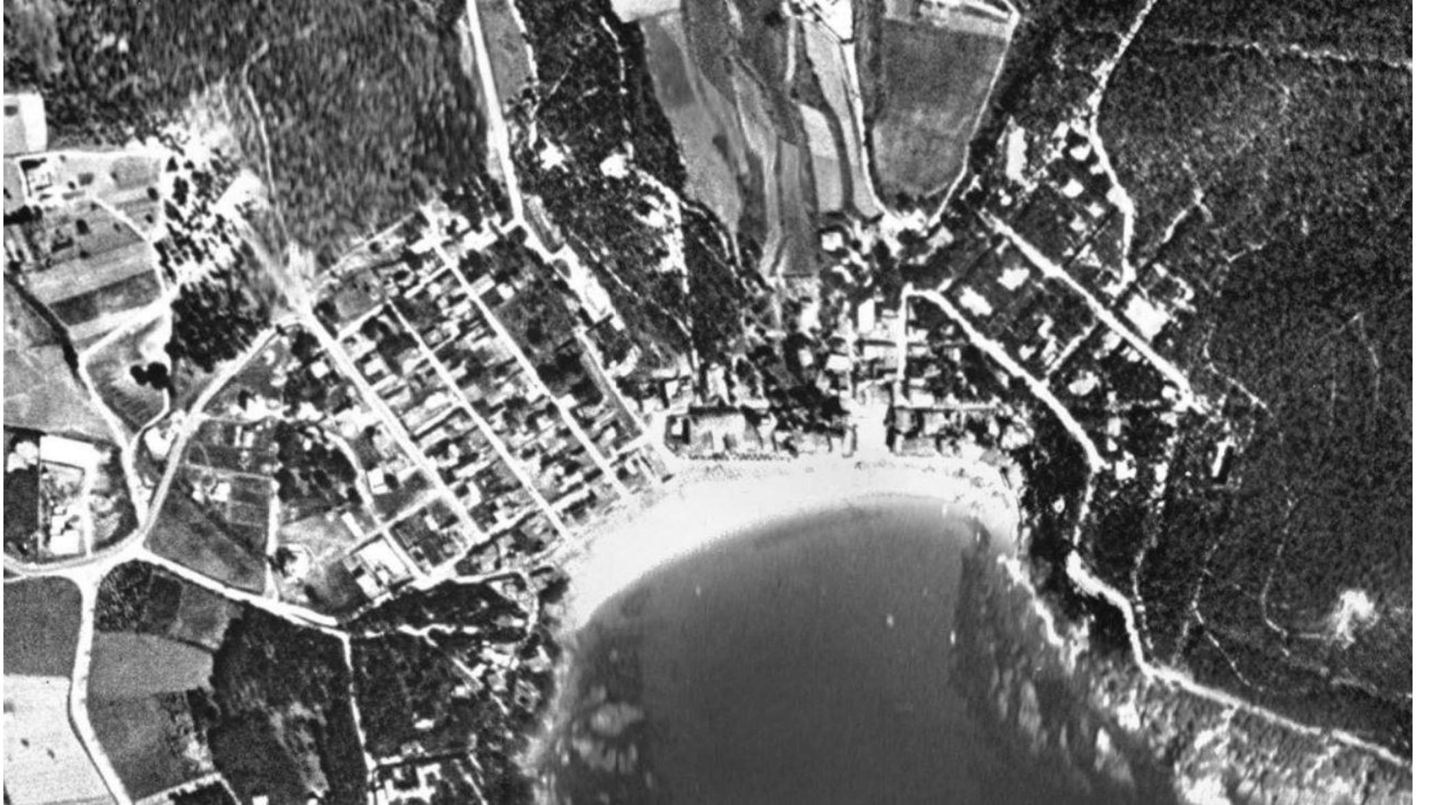
Llafranc 1956, ICGC