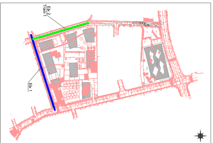
Eix 1 C/ del piner, 1 Sesna